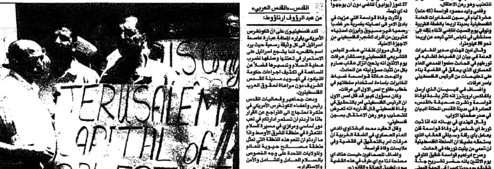
فلسطينيون يمتصون عبارات قرار الكونغرس الأمريكي في القدس بدمية ياقات كعبها القدس عاصمة تسخين (أدب)